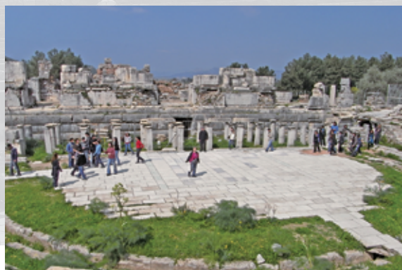
(2008年、エベソの円形劇場で歌う)

主から預かっている奉仕の前に、「自分自身を聖別しなさい」と言われる主のおことばに奉仕を委ねられていることを考えさせられています。神はモーセを呼ばれたとき仰せられました。「あなたがこの民をエジプトから導き出すとき、あなたがたは、この山で神に仕えなければならぬ。」(出エジプト 3:12) 奴隷状態にあったイスラエルの民が、神に仕えるために導き出されたように、神が、私を罪の中から贖い出してくださったのは神に仕えるためであるということ、高齢になって、もう一度確認させてくださったあわれみに感謝します。